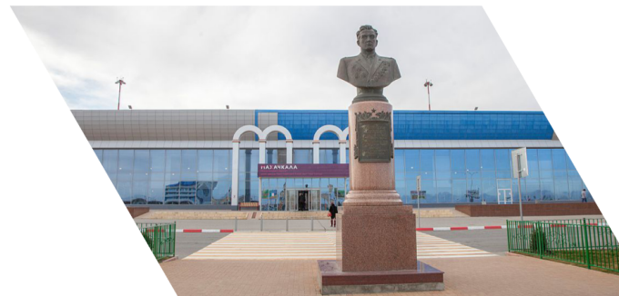
Международный аэропорт Махачкала (Уйташ) имени дважды Героя Советского Союза Амет-Хана Султана