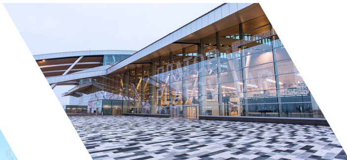
Международный аэропорт Ростова-на-Дону имени казачьего атамана Матвея Ивановича Платова